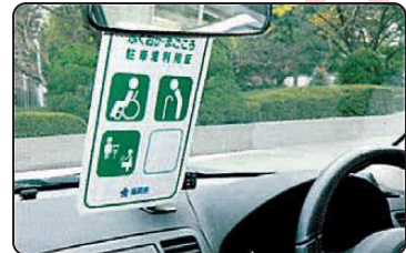
利用証をルームミラーに掛けて使用します