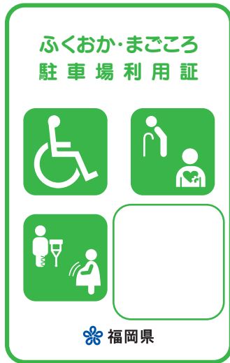
緑色 (身体・知的・精神障がいのある方、高齢者、難病者)

赤色の利用証は、車椅子常時利用の身体障がいのある方で、自ら運転する方に交付しています。幅の広い駐車場が必要な方となりますので、ご配慮をお願いします。