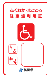
赤色 (車椅子常時利用の身障者で自ら運転)