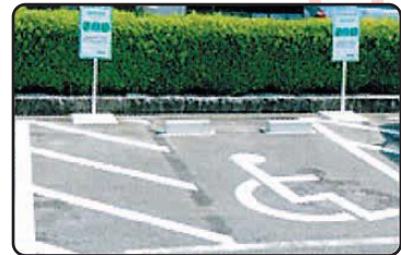
目印ステッカーが掲示してあるスペースで利用できます