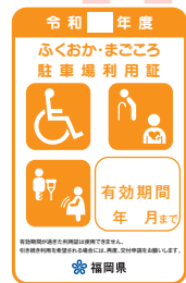
オレンジ色 (妊産婦、けが人)